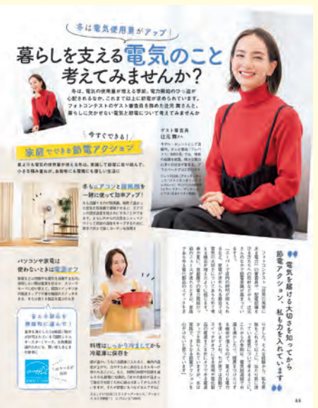
ESSE 新年号 3頁