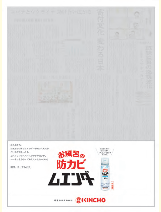
産経新聞 6月11日 5段