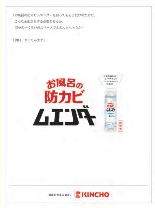
産経新聞 6月10日 15段