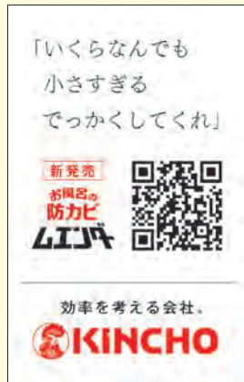
一面フロントアド