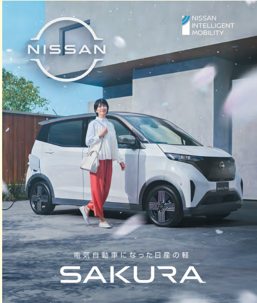
モーターファン 1頁