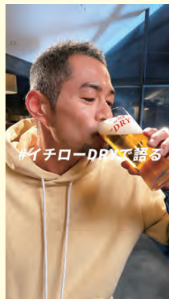
イチロー ビールとは篇