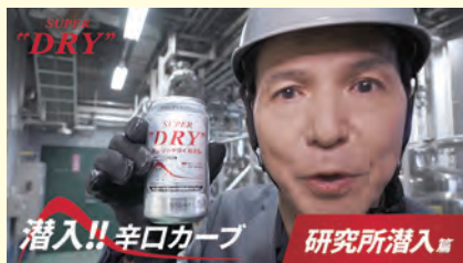
「潜入!! 辛口カーブ② 研究所潜入」篇