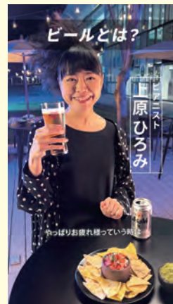
上原ひろみ ライブで一体になる感覚とは?篇