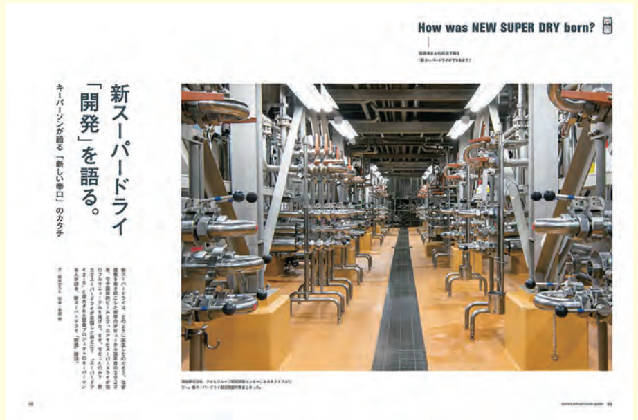
プレジデントムック スーパードライ OFFICIAL BOOK 108頁