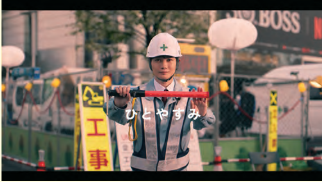
Netflix ポスフリ「僕とクルマのひとやすみ」