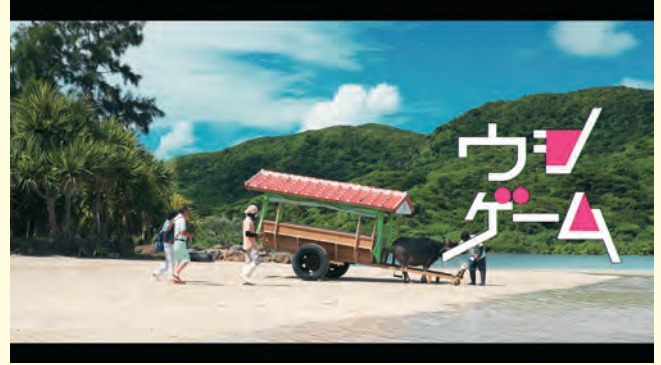
Netflix ポスフリ「ウシゲーム」