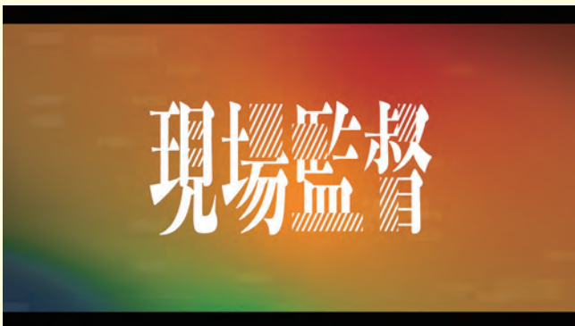
Netflix ポスフリ「現場監督」