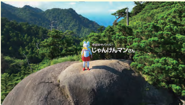
Netflix ポスフリ「とおくのサバイバー」