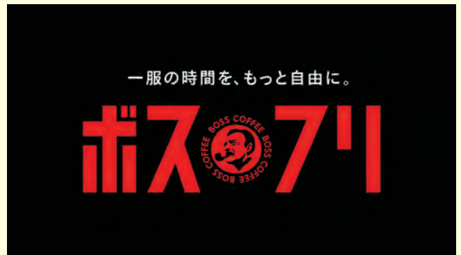
Netflix ポスフリ「告知動画」