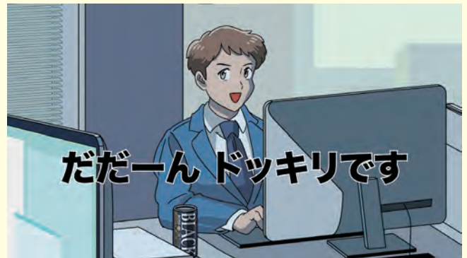
Netflix ポスフリ「ストレンジャーオフィス」